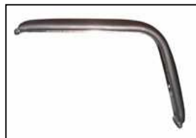
BRACCIOLO 0692 IMBOTTITO Arms 0692 padded