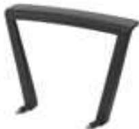
BRACCIOLI ALFA PLASTICA