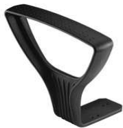
BRACCIOLI GOLL PLASTICA