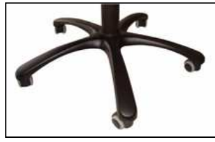
ALLUMINIO RADIS NERO Aluminium Radis black