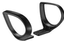
BRACCIOLO JAK PLASTICA