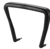
BRACCIOLO 0694 PLASTICA