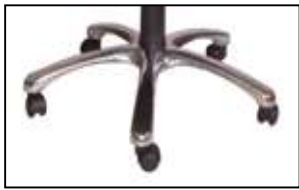
ALLUMINIO RADIS CROMATA Aluminium Radis chromed