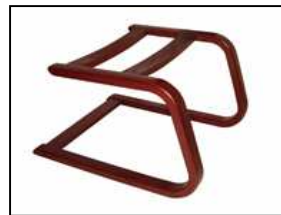
BASE FISSA LEGNO Cantilever beech wood base