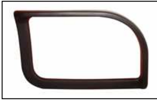
BRACC. 0644 POLIURETANO