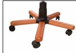
BASE GIREVOLE LEGNO FAGGIO Swivel base beech wood