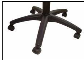
BASE PLASTICA ELLITTICA Elliptic plastic base