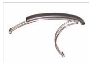
BRACC. CLIO IMB.+MET.CROM. Arms Clio padded + metal chrom.