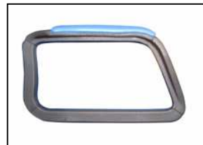
BRACCIOLO 0680 POLIURETANO Arms 0680 polyurethane