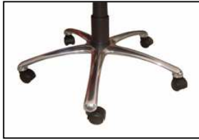
ALLUMINIO GALA' CROMATA Aluminium galà chromed