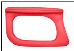
BRACCIOLO 0645 IMBOTTITO Arms 0645 padded