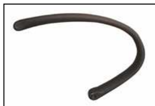
BRACCIOLO 801 POLIURETANO Arms 801 polyurethane