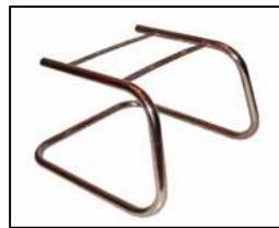
BASE FISSA CROMATA Cantilever chromed base